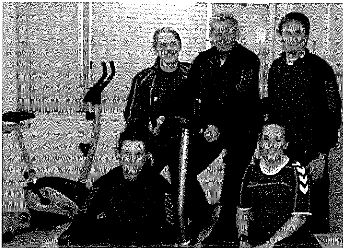
Paramedische team DETO

Blessureregistratieformulier ontwikkeld. Dit formulier staat onderaan de medische pagina op de DETO site (clubinfo medisch). Deze kan digitaal worden ingevuld en per mail worden verstuurd naar fysiodeto@gmail.nl . Een van de leden van het team, zal contact opnemen en een afspraak maken om de blessure nader te onderzoeken. Het team zal advies geven, hoe de blessure te behandelen of eventueel door te verwijzen naar een fysiotherapeut.