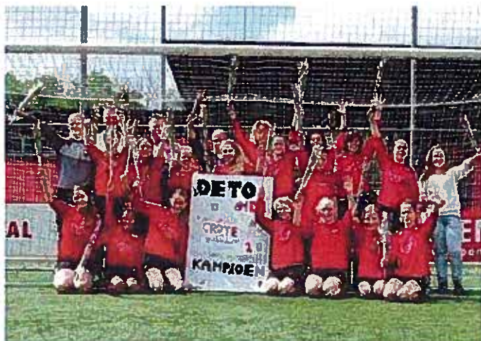
DETO MD1 Kampioen

DETO MD1 kende wel een perfect seizoen en stond na de laatste speeldag op de gewenste plaats 1. Om kampioen te worden moest men met minimaal 15 doelpunten verschil het inhaalduel winnen van de nummer laatst SVZW. Waar niemand dit voor mogelijk had gehouden, ging het extra offensief ingestelde team vol goede moed aan de slag en won na een ruststand van 9-0 met maar liefst 19-0 de laatste wedstrijd en eindigde dus toch nog als de terechte kampioen. Vermeldenswaardig is het feit dat dit team, dat ook in de ME1 al samenspeelde in de afgelopen 3 jaar in 6 halve seizoenen (voor- en najaar) maar liefst 4 keer de kampioensvlag kon hissen!