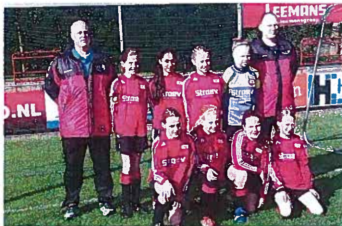
DETO ME 1 Kampioen

Het tweede kampioensteam bij de DETO Meisjes is DETO ME2. Deze meiden gingen vanaf de eerste speelronde aan de leiding en stonden de koppositie niet meer af. Ongeslagen werd de titel gepakt en kon er feest gevierd worden.