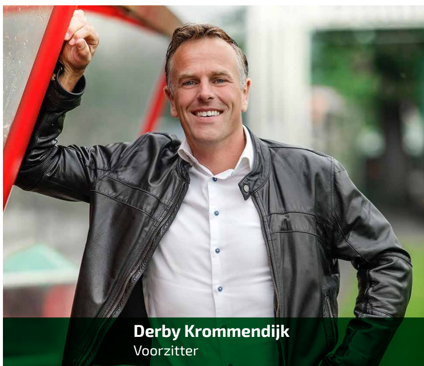
Derby Krommendijk Voorzitter

De vereniging draait weer, laten we er met elkaar van genieten er zuinig op zijn en er voor zorgen dat we dat nog lang kunnen doen. Ik reken op uw steun en medewerking de komende periode wat betreft het naleven van de coronaregels. Ook daarin zijn we elkaar nodig. Ik wens jullie veel plezier met het lezen van deze nieuwsbrief en heel graag tot ziens bij DETO!