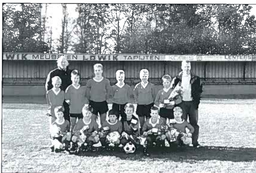
Een jeugdteam voor de tribune