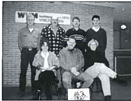
Het huidige jeugdbestuur