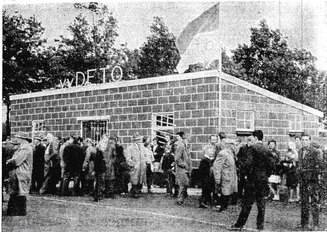
Het fleurige rood-witte clubgebouw van Deto, gebouwd in noeste vlijt, werd een resultaat, dat de talrijke kijkers zaterdag tot bewondering dwong.