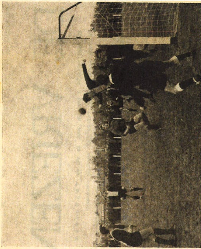
Waren de Deto-aanvallen sporadisch, toch maakten wij deze foto voor het Dos-doel, waaruit blijkt dat deze aanval geenszins van gevaar ontbloeit is, want het is midvoor G. Schipper die zijn broer, de keeper, met een kopbal moet assisteren.

vrije trap werd door G. Schipper ineens ingeschoten, maar werd door de scheidsrechter afgekeurd. Even later was het Hondebrink die de achterhoede van DETO in de luren legde en beheerst scoorde. Ook dit doelpunt werd echter afgekeurd. In de 25e minuut stormde Hondebrink op het Deto-doel af, maar werd binnen de beruchte lijnen ten val gebracht. De toegewezen strafschop werd door Schipper meters naast geschoten. Toch was de doelpunten honger van de geelzwarten niet gestild, want 7 minuten voor het einde schoot Hondebrink hard in. Het schot werd door een back gestuit, maar de terugspringende bal werd een prooi van de aanstormende rechtsbuiten Schipper, die hiermee de stand op 5-0 bracht. Een grote en geenszins geflatteerde overwinning.