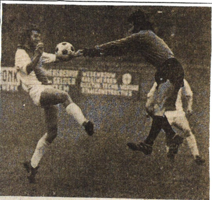
● De doelman van DETO brengt bij deze aanval van WHC redding ...