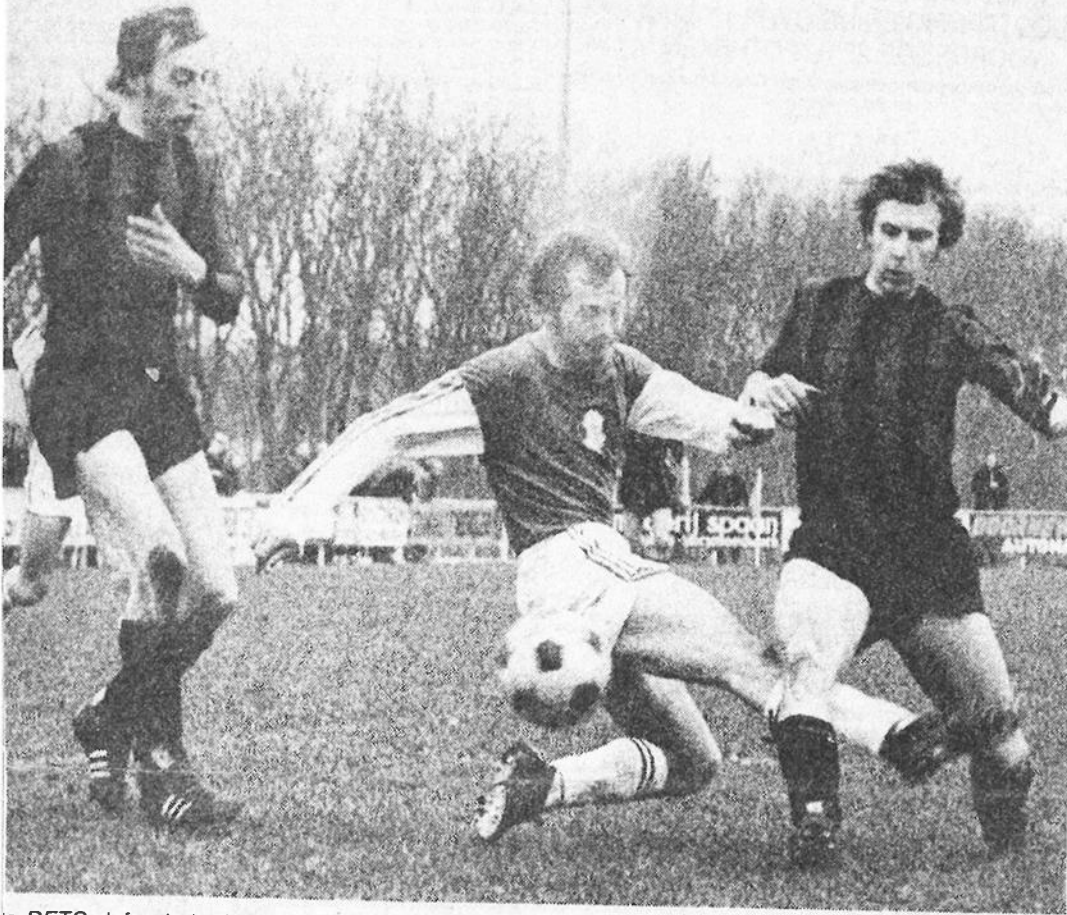
De DETO-defensie in duel met een Oldebroeker.