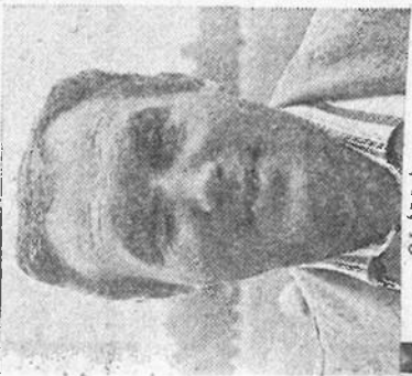
32-34, 41, 46

Steen: „Door die achterstand moest Owios wel pressie uitgaan oefenen en kwamen we een beetje in de klem te zitten. Toch hadden we van dat aandrigen gebruik moeten maken, want voor ons zijn er genoeg mogelijkheden geweest”. DETO begon zelfbewust aan het kar-