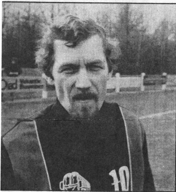
Kleine Geert ... grote man bij DETO .....

Op mijn drieëndertigste zei ik al tegen DETO's trainer Steunenberg nog één aar en dan bekijken we het nog weleens. Het is steeds van jaar op jaar gegaan en het loopt nog steeds. Ook volgend seizoen ben ik beschikbaar. Trainer Philippo heeft al laten doorschemeren, lat hij het graag had, dat ik volgend jaar veer van de partij ben. Ik heb nauwelijks neer leeftijdsogenoten in de eerste klasse. Plat van Volendam was ook 39 en de laatste man van Heerjansdam, die is ook 38 jaar. Om het vol te houden heb je ambitie nodig, anders ga je niet zolang loor. Ik heb wel het voordeel, dat mijn gezin meeleeft en meegaat. Dat was anders toen de kinderen klein waren. Mijn vrouw mopperde toen weleens en zei: „alweer voetbal. Het is nu zo, dat mijn vrouw en ook de kinderen elke zaterdag bij thuis- en uitwedstrijden erbij zijn. Onze Hans speelt nu zelf. Het lukt helemaal best zo.