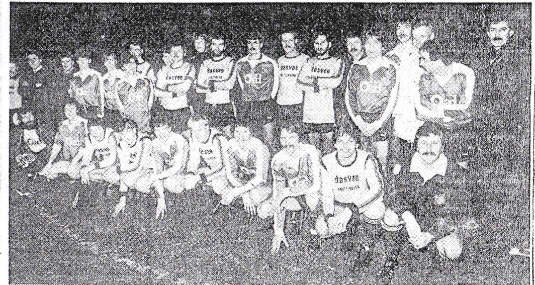
DOS'37 en Deto samen op de plaat.

De tweede helft kenmerkte zich door een uiterst boeiende vertoning. DETO, met absoluut méér individuele klasse in huis, veroverde weliswaar in de beginfase een veldmeerderheid, maar stuitte voortdurend