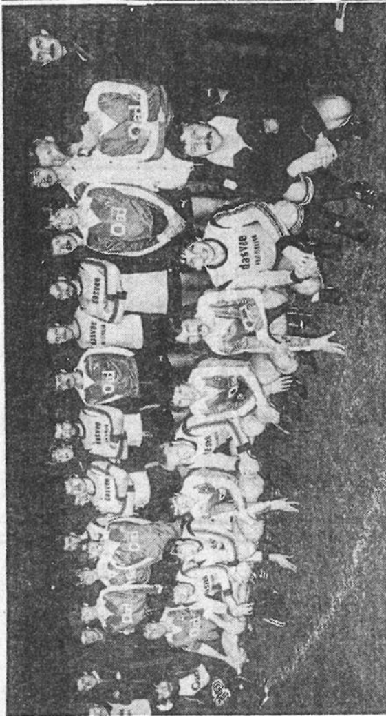
DOS'37 en Deto samen op de plaats.

De tweede helft kenmerkte zich door een uiterst boeiende vertoning. DETO, met absoluut méér individuele klasse in huis, veroverde weliswaar in de beginfase een veldmeerderheid, maar stuitte voortdurend