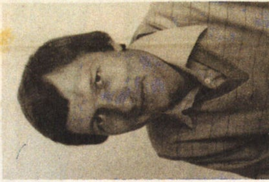
G.P.-er H. J. Slot Geen subsidie aan de schietvereniging.

Geen bestemming winkel op pand Westeinde 443, omdat gemeente de zónering heeft vastgelegd in bestemmingsplan dorpsstraat.