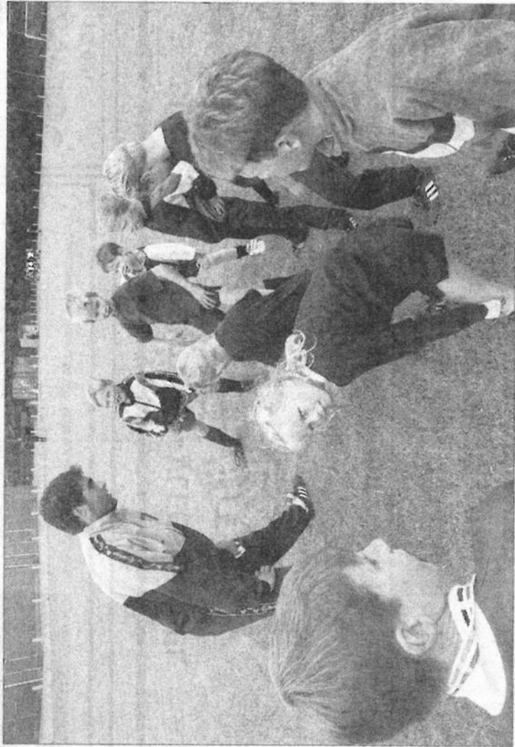
Een aantal selectiepelers van Heracles kwam zaterdag naar het sportcomplex Het Midden om 'het jeugdige potentieel' van Deto eens extra onder handen te nemen.

De Heraclesdag werd afgesloten met 'een gezellig samenzijn' onder het genot van een hapje en een drankje, met als belangrijkste gespreksonderwerp de start van de competitie op 5 september. Tegenstander in die eerste wedstrijd... 'eeuwige' concurrent, plaatsgenoot DOS '37. 'Dat wordt meteen een klapper met duizend toeschouwers langs de lijn', luidt de algemene verwachting.