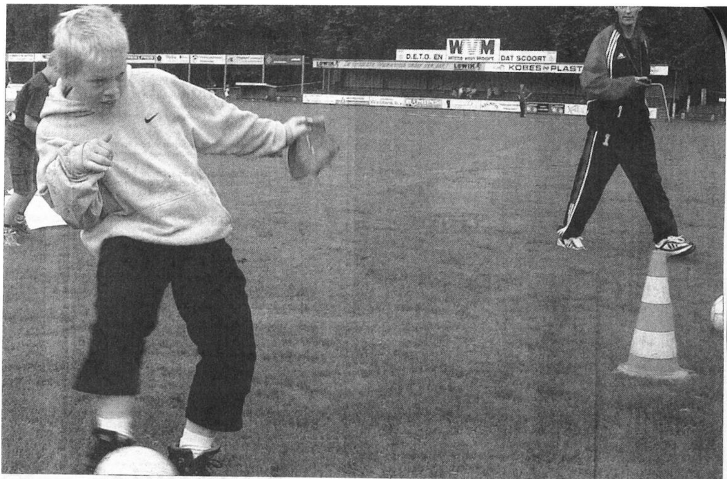
De jeugd kon zich niet alleen vergapen aan spelers van het eerste van Deto maar kon zelf ook een balletje trappen.