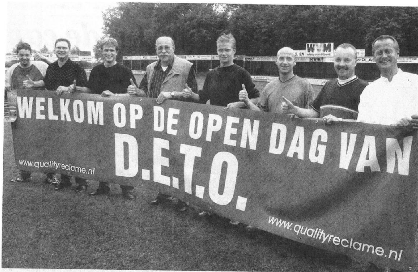
Met man en macht wordt binnen voetbalclub Deto gewerkt om de eerste open dag tot een succes te maken.