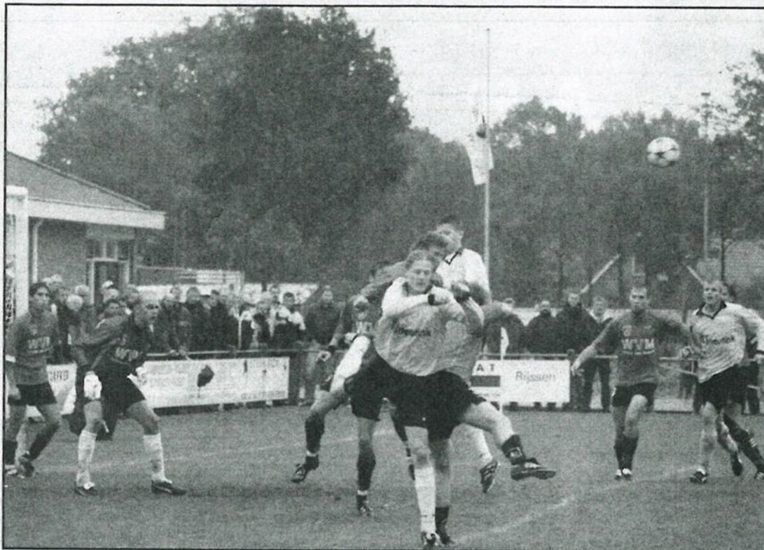
Een aanval van SVZW.

WIERDEN - In een spannende wedstrijd hebben de Wierdense Zwaluwen en Deto uit Vriezenveen de punten gedeeld.