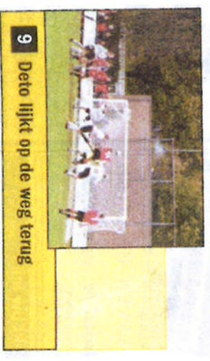
9 Deto lijkt op de weg terug

In het laatste half uur konden Ercan Sancar, die één keer via het scheenbeen van Rik Steen de lat raakte en bij een andere kans de bal naast het doel frommelde, en Folbert, die Lesscher op zijn pad vond, de stand naar 1-2 tillen, maar dat gebeurde tot spijt van het Vriezenveense kamp niet.