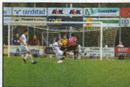
17 DETO onderuit tegen Excelsior