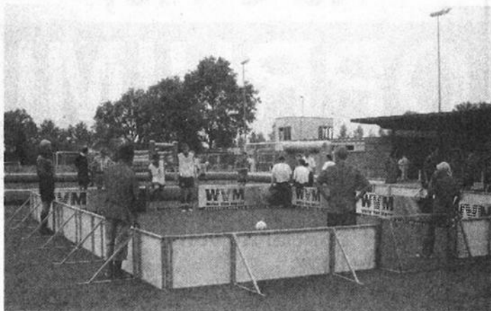
Boardingvoetbal was op de Open Dag DETO erg favoriet

is het eerste object van een totale renovatie, die het sportcomplex ondergaat, voltooid. Men hoopt verder binnen enkele maanden de werkzaamheden aan een vernieuwde entree met overkapping, de uitbreiding met een berging en een geheel nieuwe tribune af te