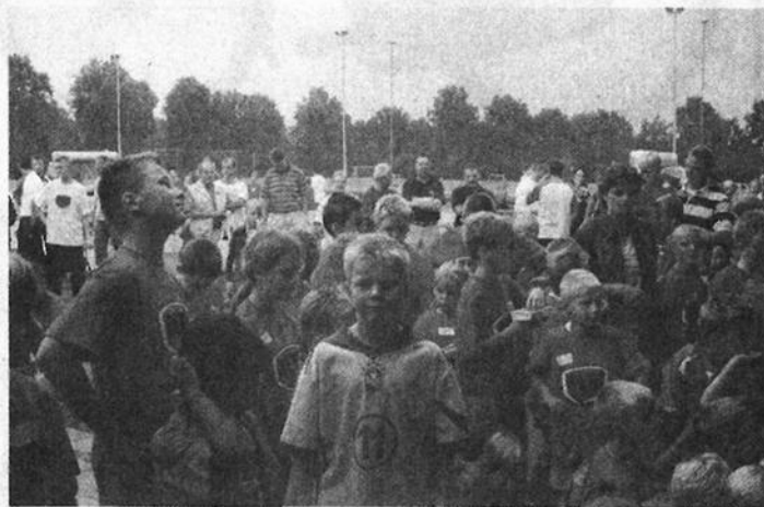
Enthousiaste jeugdleden stromen het nieuwe jeugdhonk binnen

Almelo. De Open Dag werd afgerond met een oefenwedstrijd tussen de eersteklasser DETO en de Hardenbergse hoofdklasser HHC. De publiekswedstrijd eindigde in een 1-1 gelijkspel, nadat de thuisclub het grootste deel van de wedstrijd op voorsprong had