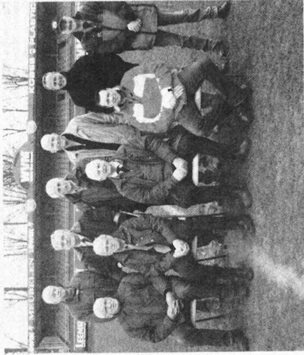
Het huidige bestuur van de supportersvereniging

Op 14 april 1967 werd de Supportersvereniging DETO opgericht. Jonge, enthousiaste supporters staken de koppen bij elkaar met het doel de voetbalvereniging op allerlei mogelijke manieren te ondersteunen. Nu na veertig jaar is de vereniging niet meer weg te denken van sportpark 'Het Midden'.