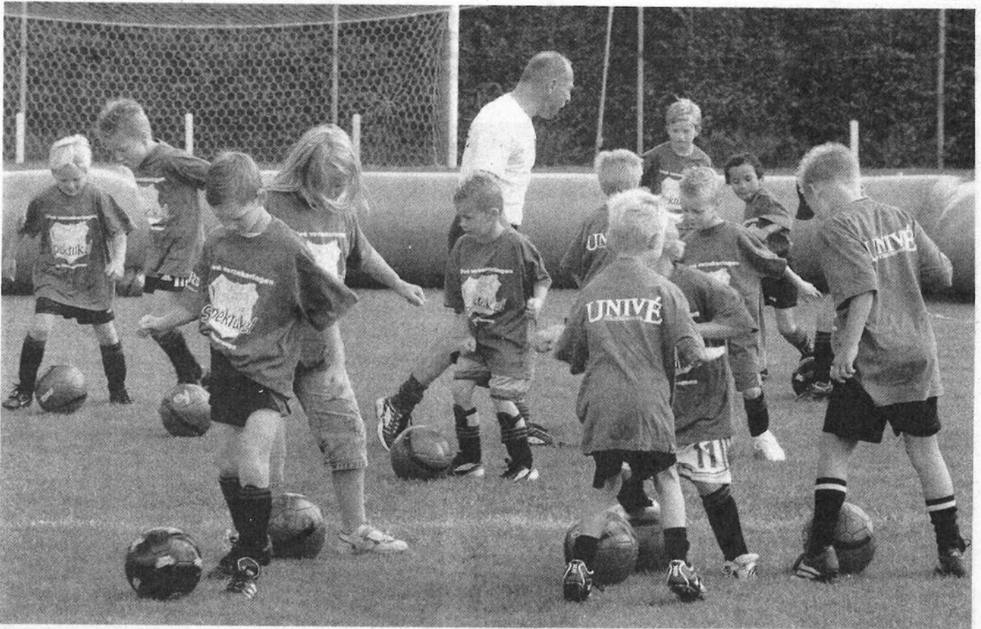
Grote belangstelling van kinderen voor de open dag van de Vriezenveense voetbalvereniging Deto. Door dit soort dagen aan te bieden hoopt de club nog meer jeugd aan zich te binden.