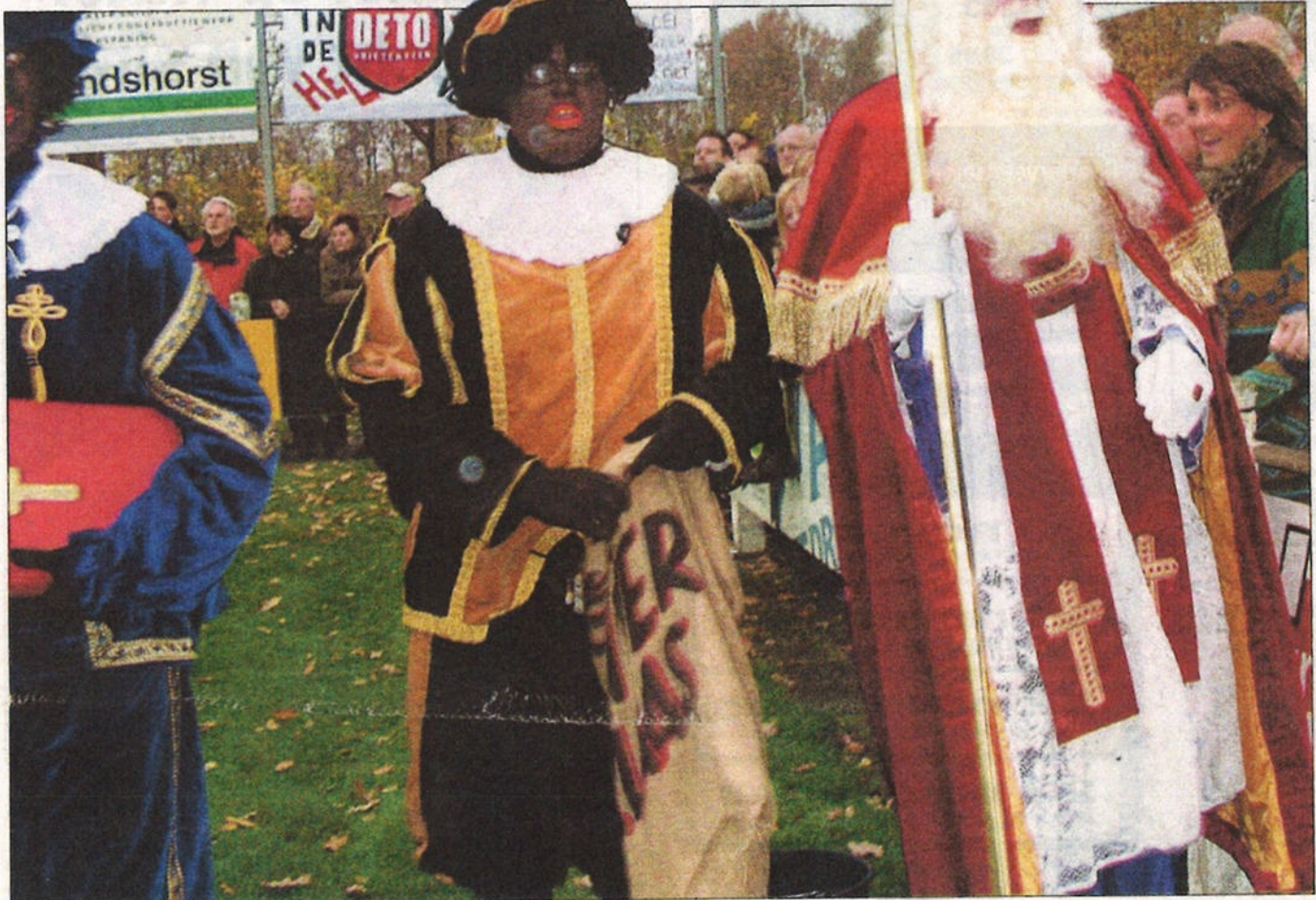
Geen aftrap voor sinterklaas, wel een rond rondom het veld tijdens Deto-DOS'37.

Intocht sint en voetbalderby Deto-DOS'37 op dezelfde dag