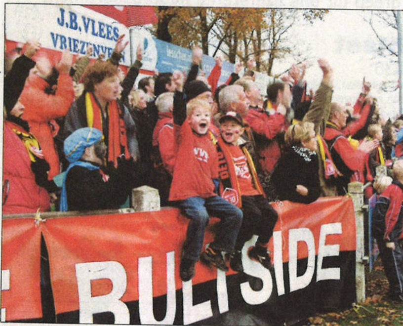
De drieduizend toeschouwers zorgden voor een geweldige sfeer. Uiteraard was de stemming in het rood-zwarte kamp het beste.