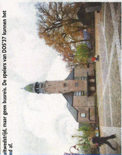
0 uur, een half uur voor het duel is het centrum van Vriezenveen leeg.