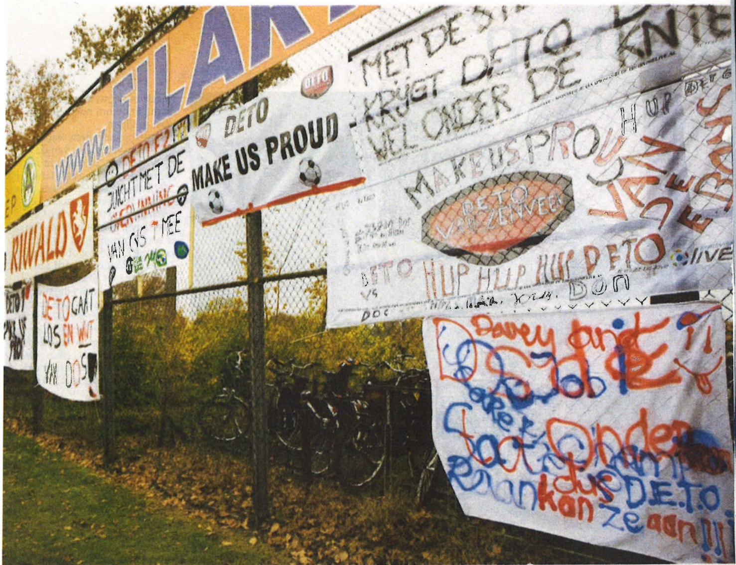
De supporters hadden zaterdagmiddag bij Deto tegen DOS de nodige aandacht besteed aan de spandoeken.