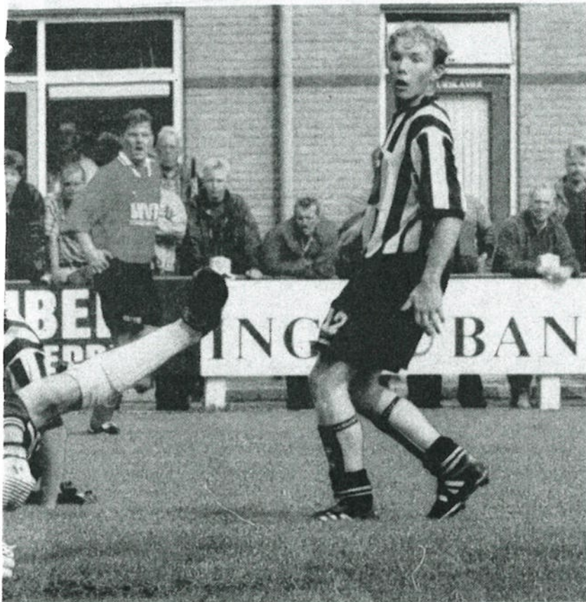
3-2 voor de thuisploeg.