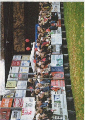
Deto is het daarentegen een drukte van belang. Ruim drieduizend schouwers zijn afgekomen op de derby van Vriezenveen.