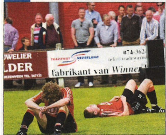
De verliezer van SVZW-Deto (of in het geval van een gelijkspel: SVZW) speelt zaterdag tegen SDV, waarna de derde wedstrijd volgt. De winnaar van de poule van drie speelt tegen de nummer twaalf uit de hoofdklasse B, Dovo.