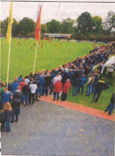
volgepakt voor de burenruzie.