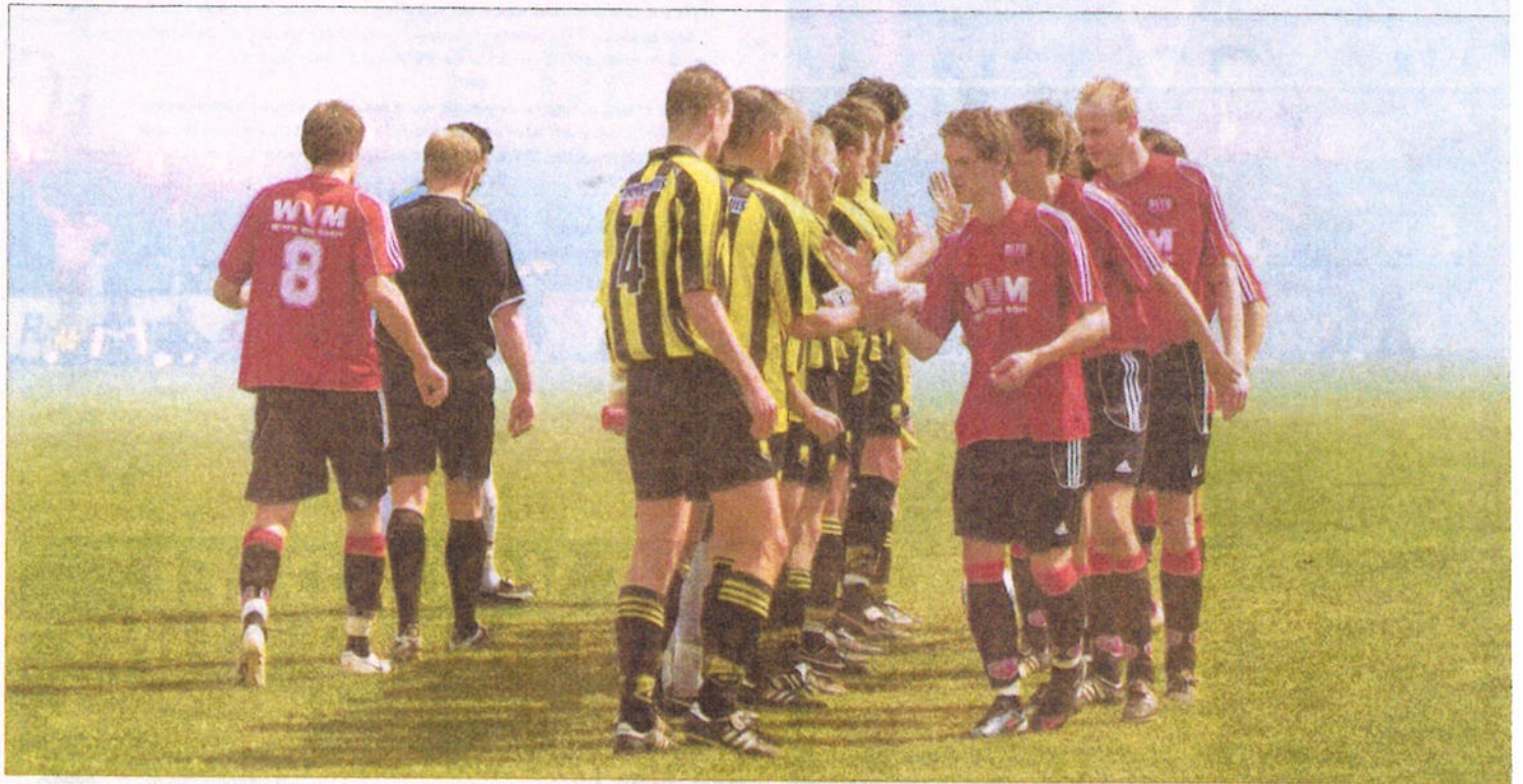
De spelers van DOS'37 en DETO begroeten elkaar voorafgaand aan de laatste ontmoeting tussen beide teams. Op 25 april 2009 won DETO bij de buurman met 3-0.

door hebben we niet alleen in de regio maar in heel Nederland bekendheid gekregen."