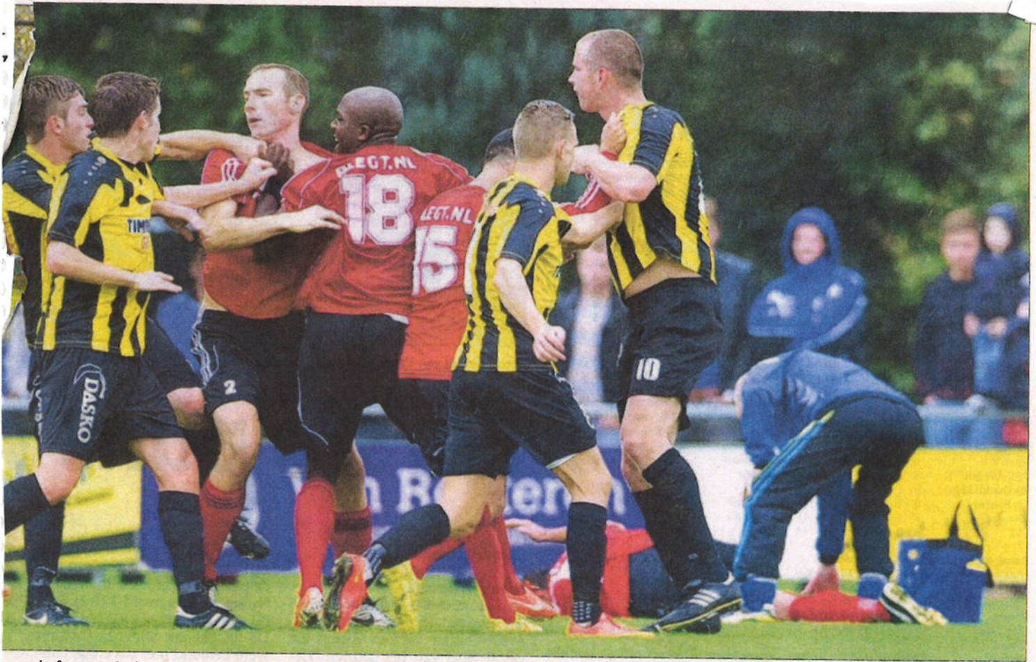
slotfase van de derby tussen DOS'37 en DETO Twenterand. foto's Frans Nikkels