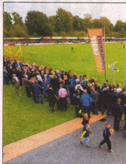
■ Het sportpark in Vriezenveen was

het doel: 1-1. „De bal werd verlengd en ik kreeg 'm ongelukkig tegen me aan, heel zuur. Dus ja, natuurlijk balen we. Maar na die gelijkmaker had ook zomaar nog de 2-1 kunnen vallen. Zo reëel moet je ook zijn.”