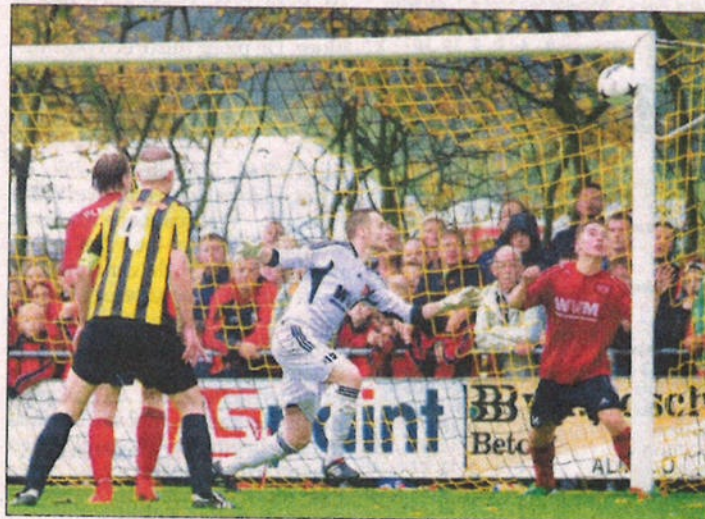
■ DOS'37 kwam kort voor tijd op 1-1 en kreeg daarna nog goede kansen.