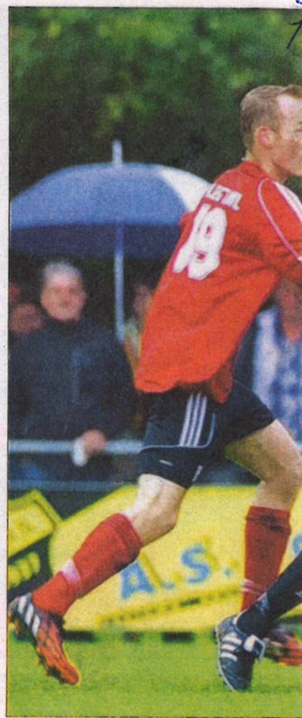
■ De vlam slaat in de pan tijdens de