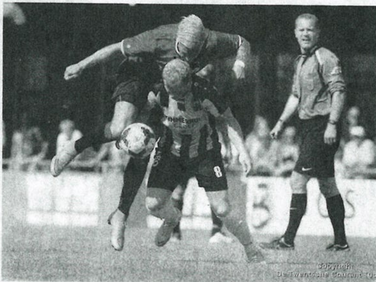
Ondanks de gevoelige nederlaag gaf de wedstrijd tegen DOS nog genoeg positieve aanknopingspunten.