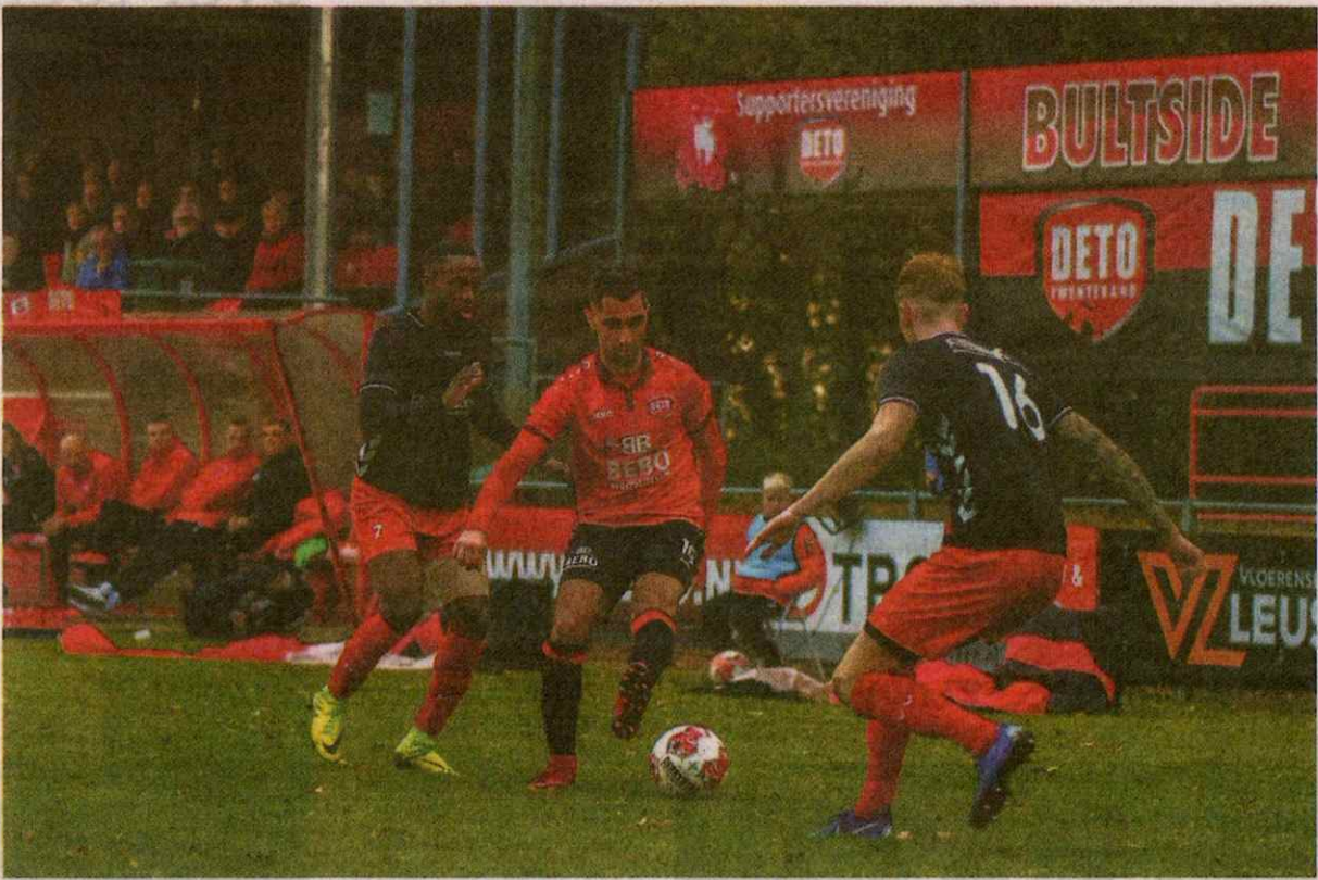
DETO verloor zaterdag op eigen veld met 0-2 van HZVV.