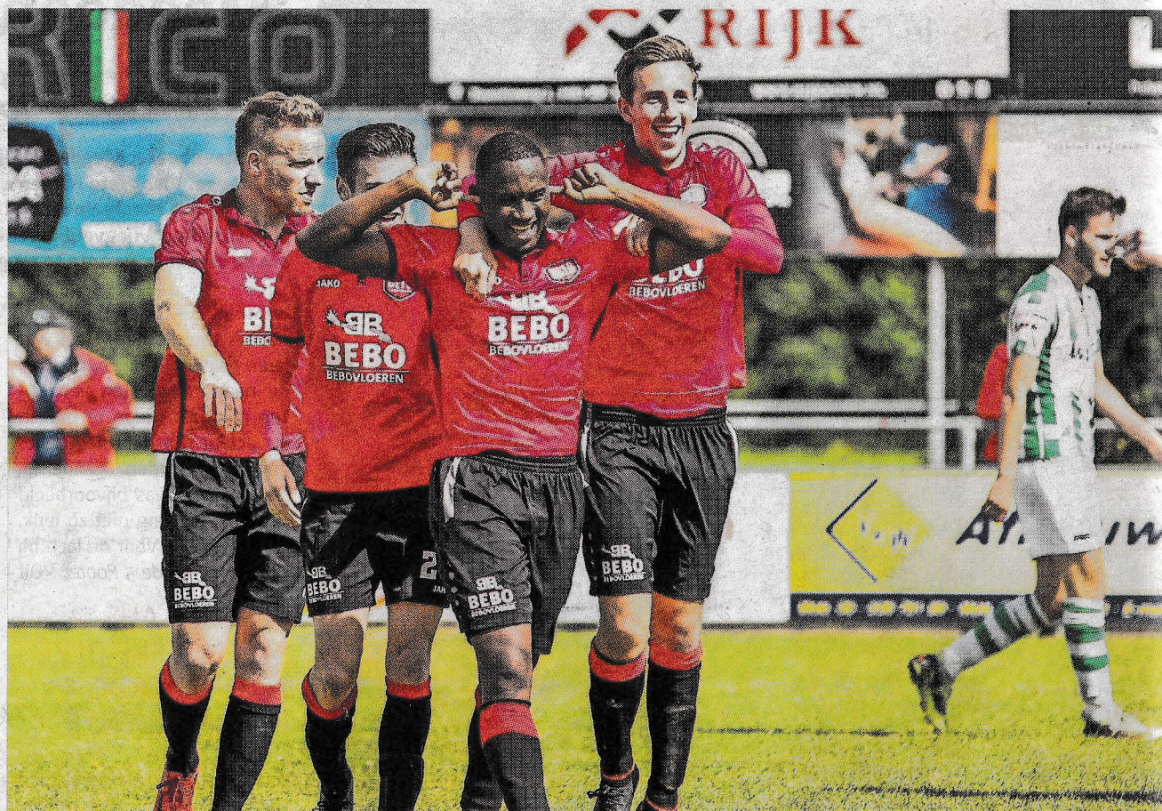
DETO won in de halve finale met 1-3 bij Kloetinge.

Twee maal werd de paal geraakt. In de slotfase kwam Sliedrecht met tien man te staan na een rode kaart voor Akram Chentouf. Na 112 minuten was er dan toch eindelijk de verdiende voorsprong voor DETO. Een aanval over links bracht Lesley Nahrwold in stelling, die de bal zuiver in de hoek schoot: